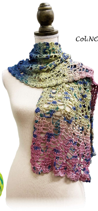
Col. NO. 11