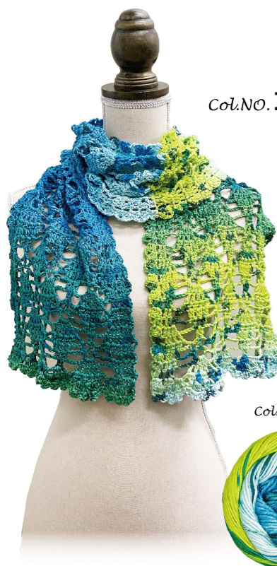
Col. NO. 14