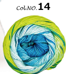
Col. NO. 14