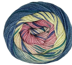
Col. NO. 11