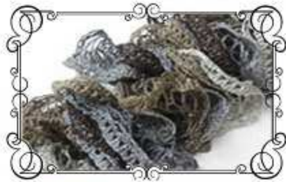
Col.No 4 ブラウンミックス