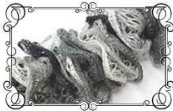
Col.No 5 グレーミックス