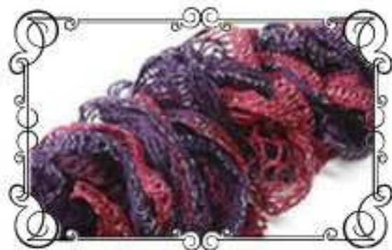
Col.No 1 ボルドーミックス