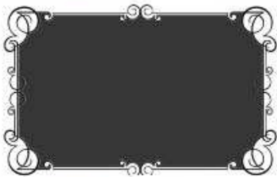
Col.No 9 ブラック(単色)