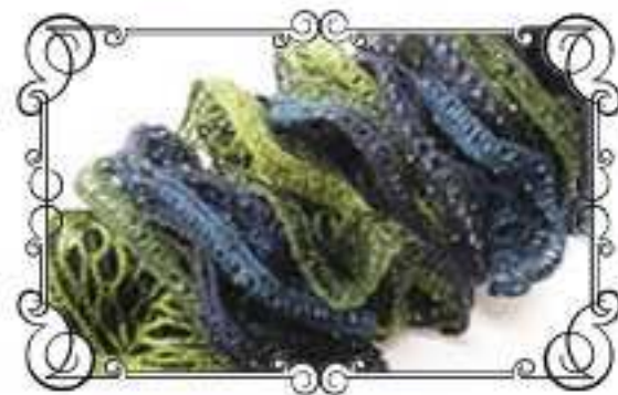
Col.No 7 グリーンミックス