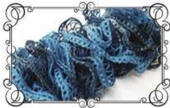
Col.No 6 ブルーミックス