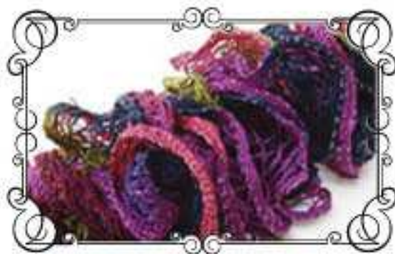
Col.No 2 ローズミックス