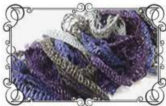
Col.No 3 パープルミックス