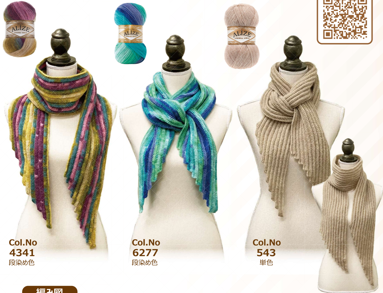
Col.No 4341 段染め色