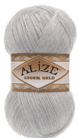
ライト グレイ メランジェ